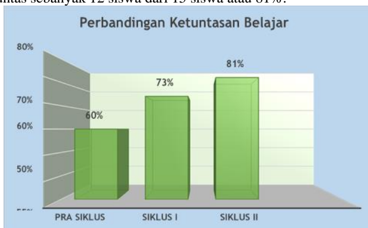
Gambar 3. Diagram Perbandingan Ketuntasan Belajar

Hasil belajar yang diperoleh menunjukkan peningkatan yang lebih baik pada saat pelaksanaan kegiatan pembelajaran tema 4 “Sehat itu penting” pada siklus II. Berdasarkan hasil observasi terhadap hasil belajar siswa dalam mengikuti kegiatan pembelajaran tema 4 “Sehat itu Penting” dengan mengimplementasikan media pembelajaran tematik menggunakan audio visual (video youtube) pada siklus II, adalah sebagai berikut: 1) proses pembelajaran tema 4 “Sehat itu Penting” sudah sesuai dengan RPP yang dirancang, 2) hasil belajar siswa meningkat dibandingkan siklus sebelumnya, dan 3) proses belajar lebih interaktif antara guru dan siswa.